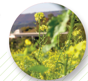
Truc & astuce sur la ligne 421