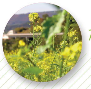
Truc & astuce sur la ligne 421